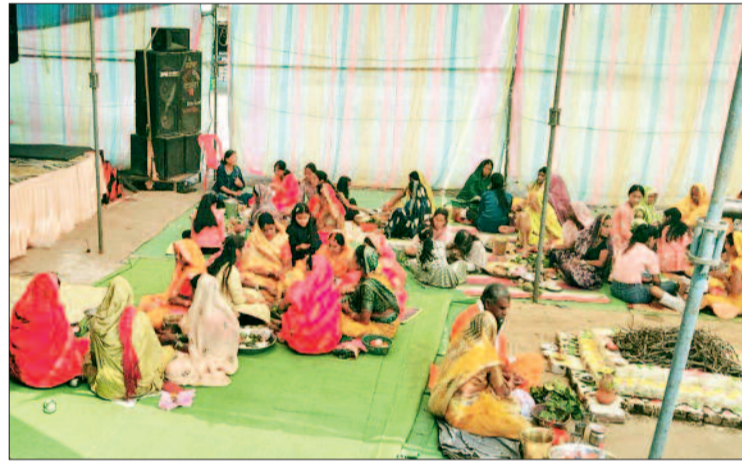
एवं शोभा यात्रा निकाली गई। महिलाएं सिर पर कलश धारण कर नगर भ्रमण पर निकलीं,

विकासखंड पंडरिया के ग्राम कंड्रेटा में सात दिवसीय श्रीशिव महापुराण साप्ताहिक ज्ञान यज्ञ का आज विधि-विधान के साथ भव्य समापन हुआ। 22 से 28 फरवरी तक आयोजित इस धार्मिक आयोजन में प्रतिदिन कथा, भजन-कीर्तन और आध्यात्मिक प्रवचनों का आयोजन किया गया। समापन दिवस पर प्रातः काल हवन-पूजन संपन्न हुआ, जिसमें श्रद्धालुओं ने वेद मंत्रों के साथ आहुतियां अर्पित कर क्षेत्र की सुख-समृद्धि की कामना की। इसके पश्चात भव्य कलश यात्रा