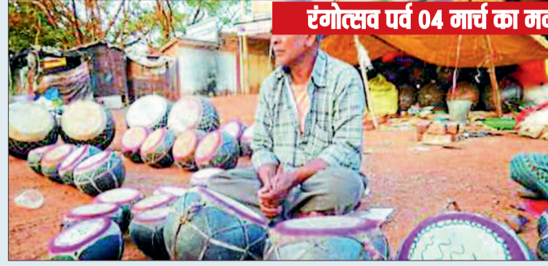
रंगोत्सव पर्व 04 मार्च का मनाया जाएगा

आधुनिकता की चकाचौंध में नगाड़ों की शोर गुम हो गई, पूर्व में होली पर्व के एक माह पहले ही नगाड़े बजना शुरू हो जाते थे, लेकिन आधुनिकता की चकाचौंध में नगाड़ों की शोर गुम हो गई। अब नगाड़ों की शोर कम ही सुनने को मिलते हैं। पूर्व में होली पर्व के एक माह पहले ही नगाड़े बजना शुरू हो जाते थे। जहां बड़ी संख्या में लोग फाग-गीत गाने व बजाने के लिए एकजुट हो जाते थे, लेकिन अब वह महज होलिका दहन और इसके दूसरे दिन ही नगाड़ा की गूंज सुनाई देता है। ग्रामीण अंचलों में रंगोत्सव पर नगाड़े की थाप कम हो चुकी है। पारंपरिक फाग-गीत कम ही सुनाई देती है। फाग गीतों व नगाड़ों की जगह अब आधुनिक ध्वनि यंत्र डीजे ने ले ली है। आधुनिकता की चकाचौंध में नगाड़ों की शोर गुम हो गई। अब नगाड़ों की शोर कम ही सुनने को मिलते हैं। पूर्व में होली पर्व के एक माह पहले ही नगाड़े बजना शुरू हो जाते थे। जहां बड़ी संख्या में लोग फाग गीत गाने व बजाने के लिए एकजुट हो जाते थे, लेकिन अब वह महज होलिका दहन और इसके दूसरे दिन ही नगाड़ा की गूंज सुनाई देता है। बदले दौर में नगाड़े की स्थान